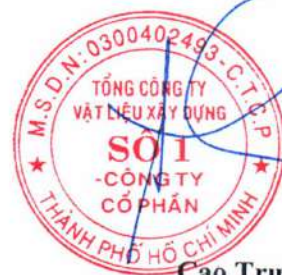
Cao Trường Thụ