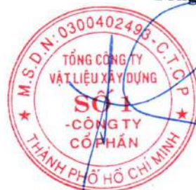
Cao Trường Thụ