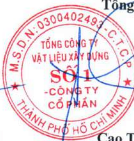
Cao Trường Thụ